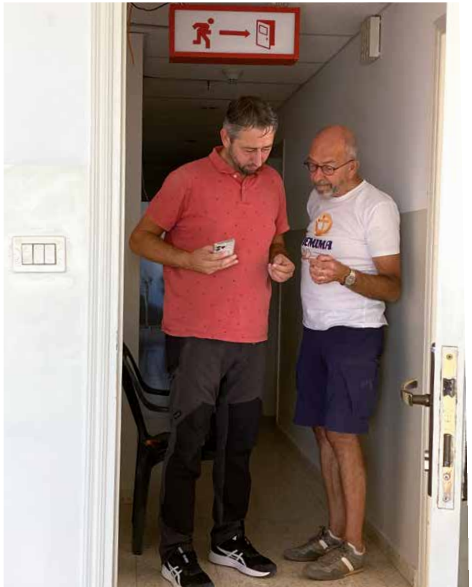
Markeringen voor vluchtwegen