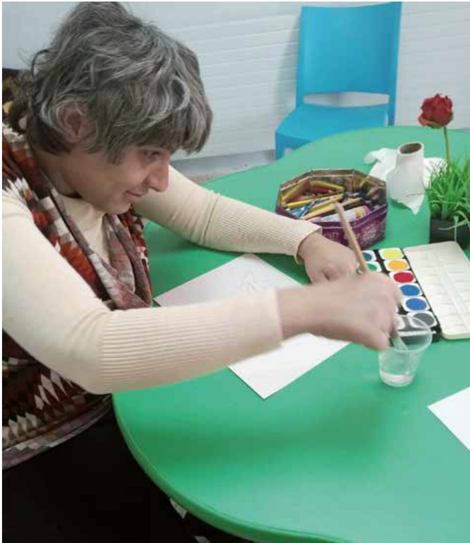
Het gaat beter met Maram

Op het moment van schrijven (mei 2024) is het gelukkig nog steeds relatief rustig en veilig in Bethlehem en Beit Jala. Het reguliere werk kan nog steeds doorgaan.